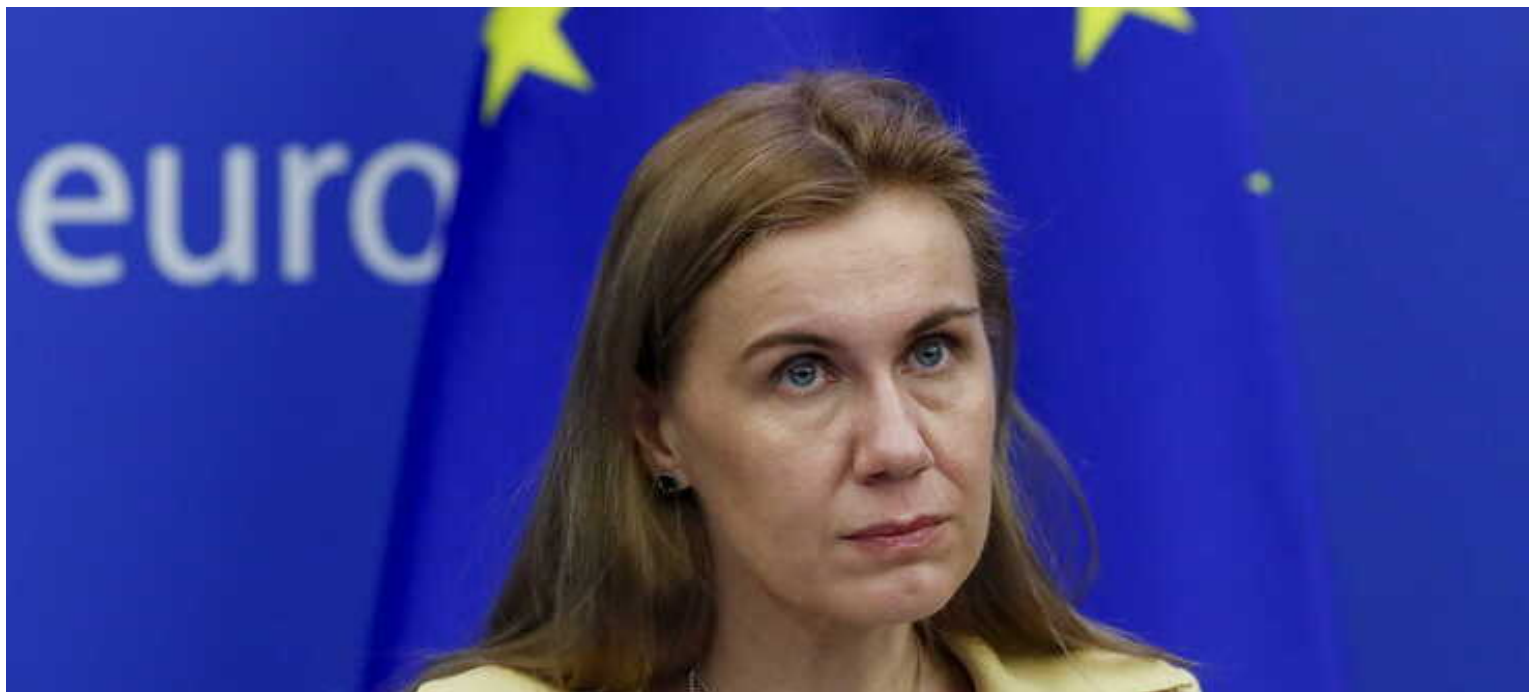
Kadri Simson, comissária europeia da Energia