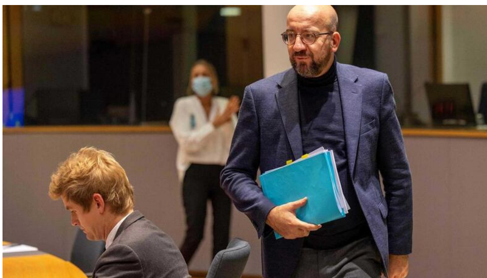
O presidente do Conselho Europeu, Charles Michel

A escalada dos preços da energia será o tema dominante no debate da cimeira europeia em Bruxelas.