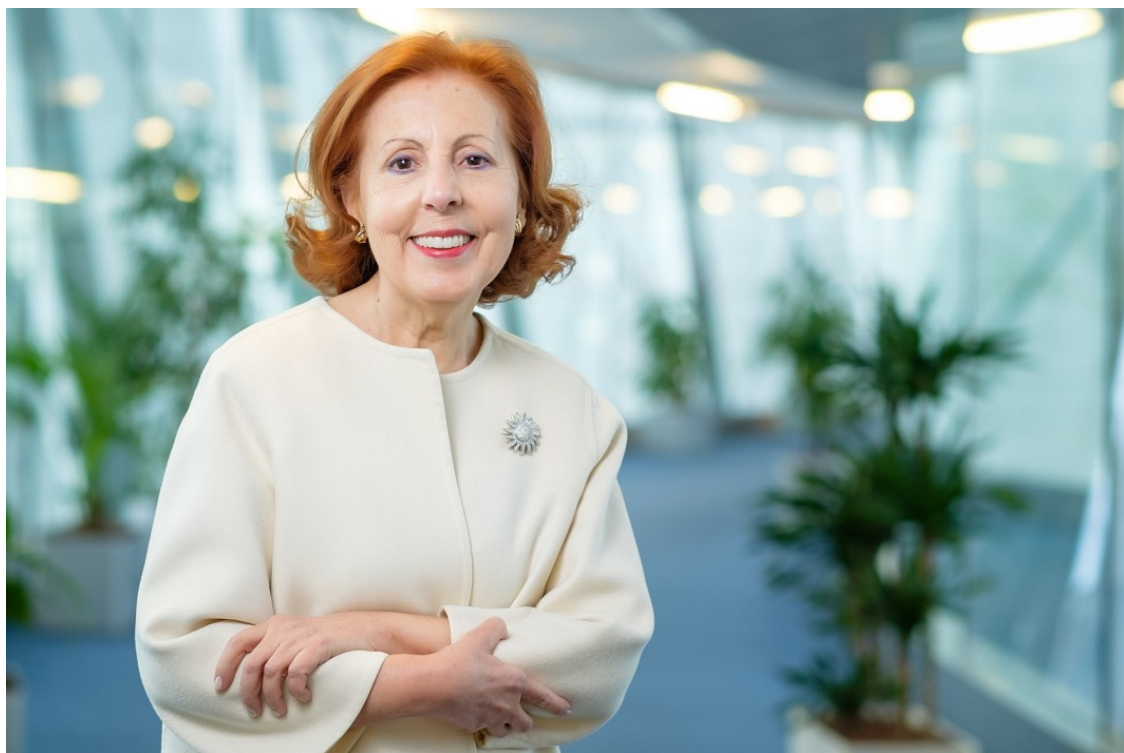
Maria da Graça Carvalho defende importância dos setores culturais e criativos.

A deputada ao Parlamento Europeu, Maria da Graça Carvalho , defendeu, durante o evento online de lançamento do Culture Klrc Fest , a importância de ser dada a devida atenção aos setores culturais e criativos . O evento foi promovido pela região do Alentejo com cofinanciado da União Europeia e apoiado do governo português e por diversos organismos alentejanos.